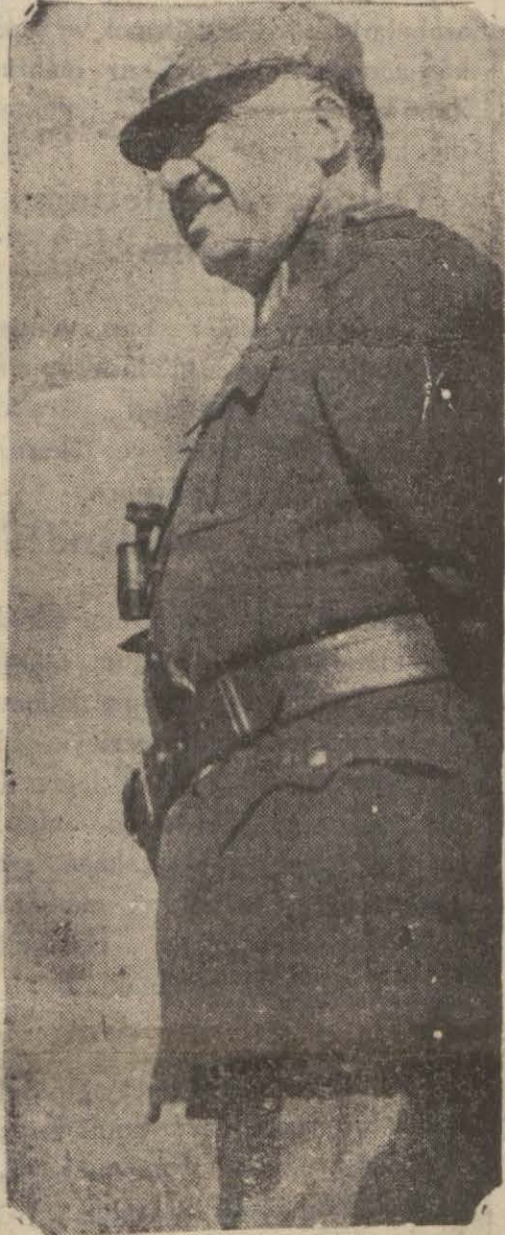
Mareşalimiz Fevzi Çakmak

Mareşalimize halkın iştirakile büyük karşılama merasimi yapıldı